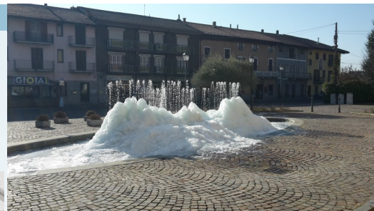
San Giusto Canavese—fontana invernale