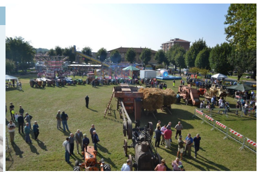
San Giusto Canavese — Fiera